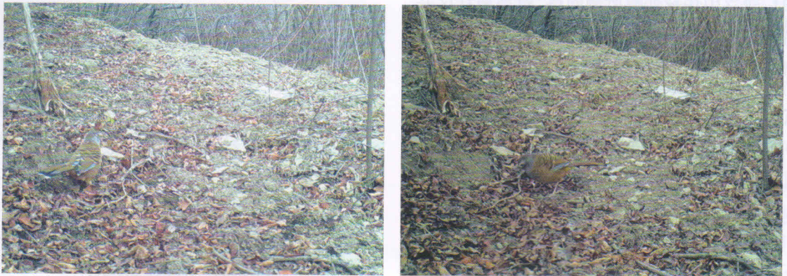
图 1 六盘山国家级自然保护区斑背噪鹛 Garrulax lunulatus 的红外相机照片

在保护区安置的 10 台红外相机共拍到 30 只次不同季节斑背噪鹛活动的 70 张照片和 6 段视频资料, 发现地点皆为较为隐蔽的以栎为主的山地落叶阔叶灌丛和以落叶松 Larix gmelinii 为主的针叶林及落叶松和栎为主的针阔混交林的林缘草地, 海拔 1 800~2 600 m(表 1), 说明斑背噪鹛在宁夏六盘山地区是一种留鸟。之前无斑背噪鹛的记录, 六盘山分布的斑背噪鹛是当地固有的种群还是由于调查手段和时间的不足而未记录到, 还是可能在近年来全球气候变暖的背景下由南部迁移而来, 均有待深入调查, 同时也需要在附近的小陇山、子午岭至秦岭一带进一步确认中间地带是否有该鸟的分布。